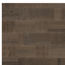
Noble Oak Wasa