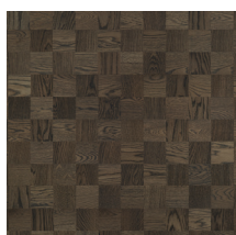
Noble Oak Chelsea