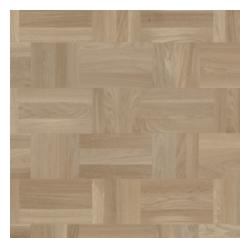
Noble Oak Art Deco