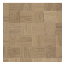
Noble Oak Soho