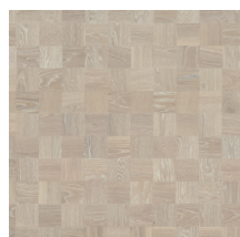
Noble Oak Manhattan