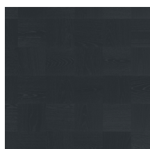
Noble Oak Broadway

Bildene viser bare fargen på gulvet. For flere detaljer om gradering og variasjoner se Grading Bok eller www.tarkett.no . Tarketts internasjonale utvalg av gulv består av mange forskjellige produkter. Noen av disse er ikke for salg i Norge. Selv om alle bildene som er tatt for å gjengi det ferdige produktet er gjort på best mulig måte, kan kvaliteten på skjerm og skriver samt naturlig variasjonen i trevirket resulterer i variasjoner i farge og struktur av de enkelte parkettbord.